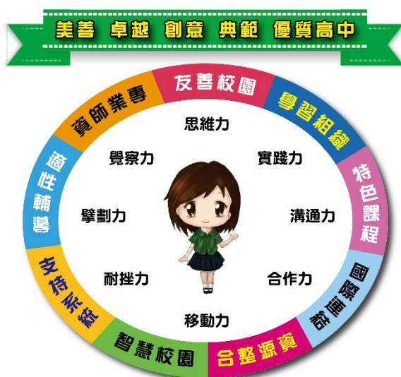
臺中女中學校願景及學生圖像