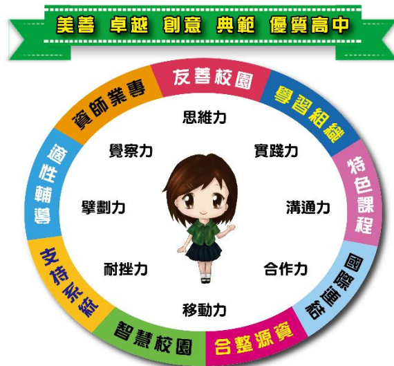
臺中女中學校願景及學生圖像